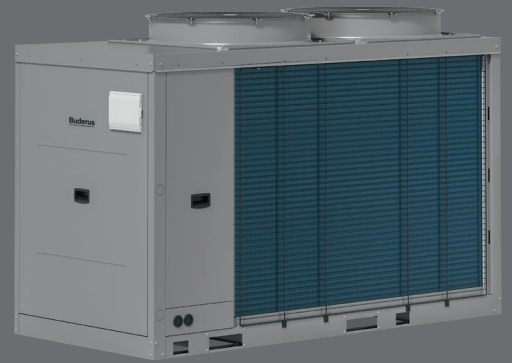
Gerätevariante mit 31 kW bis 41 kW Leistung

Ihr kompetenter Partner für Systemtechnik: